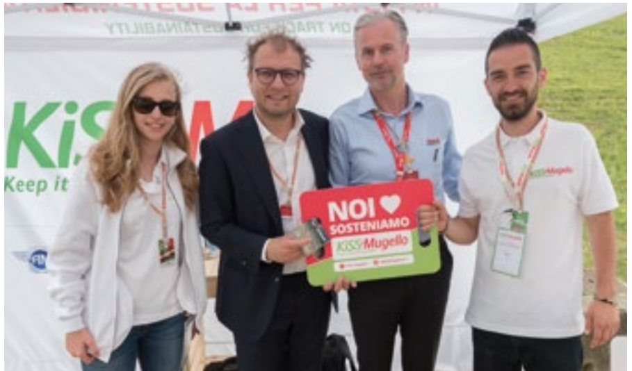
Il team kiss mugello con il ministro per lo sport Luca Lotti.

Per promuovere la raccolta differenziata, KiSS Mugello lavora su varie piste d'azione. Innanzitutto c'è la presenza diffusa lungo il circuito di isole ecologiche , provviste di contenitori ad hoc per la raccolta dei vari tipi di rifiuti differenziabili (rifiuti organici, vetro, plastica, metalli, tetrapak, polistirolo, carta e cartone, anche le pile esauste). Poi la diffusione di materiale informativo , dal taglio quasi didattico, tanto al pubblico quanto al personale che lavora sia nei box, sia negli hospitality dei team sportivi all'interno dei paddock (dove avviene anche la raccolta degli oli alimentari esausti e degli oli lubrificanti usati). Ma c'è anche un grosso lavoro della Crew di KiSS Mugello , che durante i tre giorni del Gran Premio presidia gli info-desk disposti lungo il circuito, informa gli spettatori e i fans, coinvolge piloti e personaggi pubblici e famosi che accettano di supportare il programma magari posando per uno scatto - lo hanno fatto fra gli altri una leggenda della MotoGP come Giacomo Agostini , il Ministro dello Sport Luca Lotti , il cantante Piero Pelù - da postare e twittare sui social network, dove il